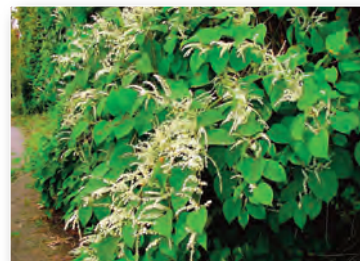
La renouée du Japon