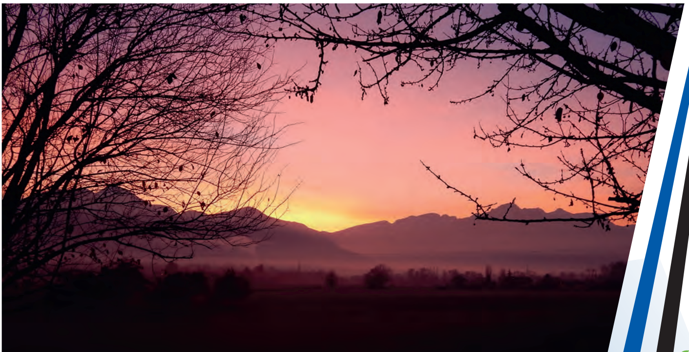
Crédit photos : Thomas Pieuchot ; Les élus ; Le service enfance jeunesse ; L'école ; Les associations